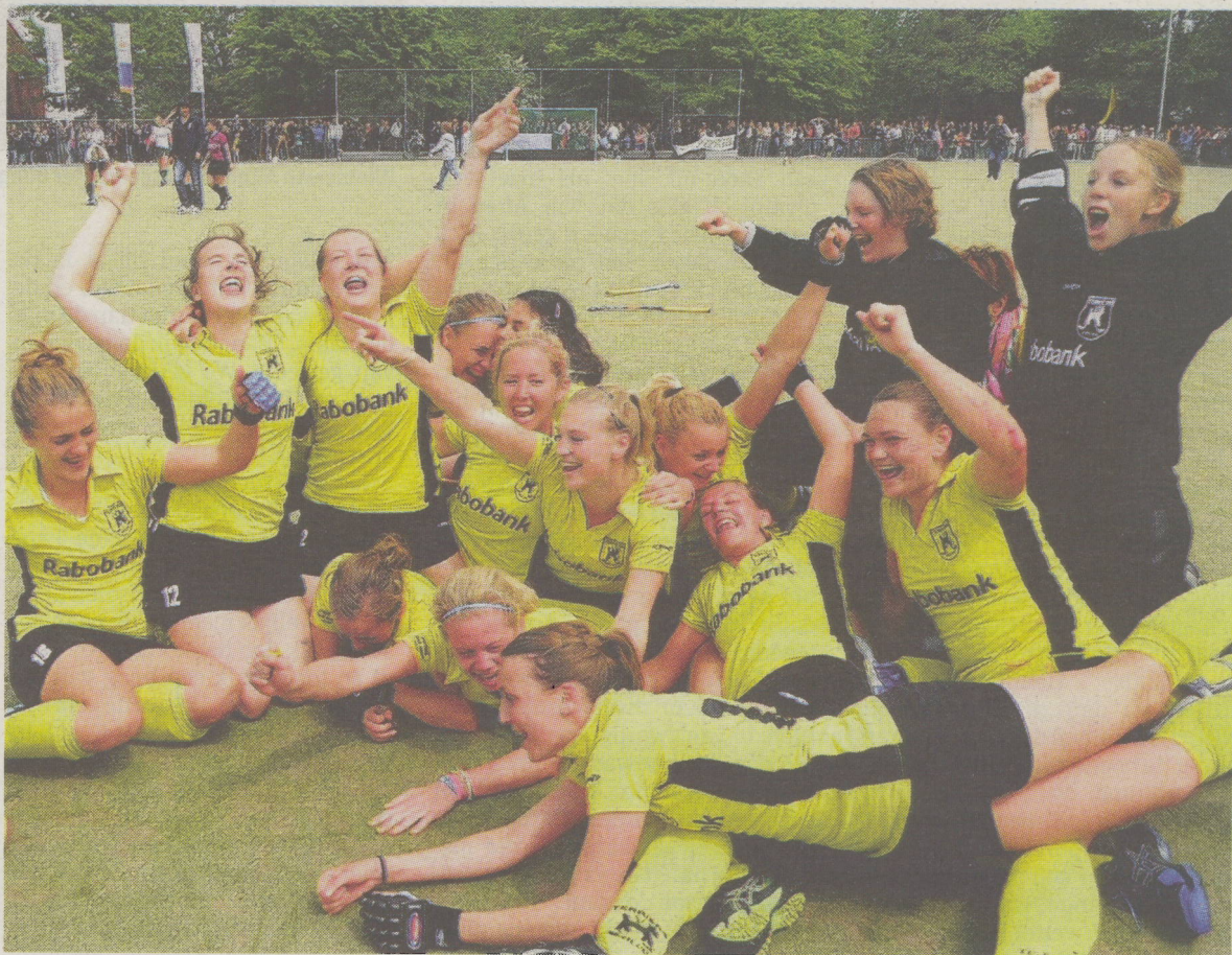
De speelsters van Terriërs kunnen hun vreugde niet op, nadat Rotterdam is verslagen.